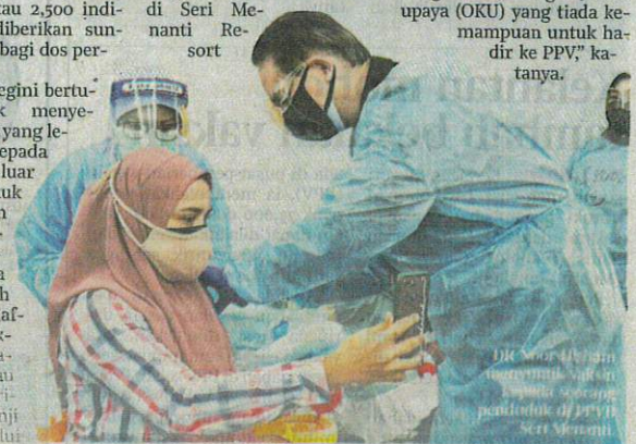
DR Noor Hisham menyuntik vaksin kepada seorang penduduk di PPVB Seri Menanti.

bagi individu yang stabil. "Dan kaedah kedua ialah menerusi lawatan rumah ke rumah dalam kawasan Seri Menanti bagi pesakit yang terlantar di rumah atau warga emas, orang kelainan upaya (OKU) yang tiada kemampuan untuk hadir ke PPV," katanya.