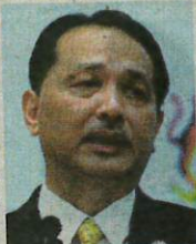
DR NOOR HISHAM

berkongsi nilai kadar kebolehtangkitan Covid-19 atau R-naught (Rt) di Malaysia pada Rabu adalah 1.16 dengan Terengganu mencatatkan nilai tertinggi iaitu 1.33, diikuti Kelantan (1.26) serta Sabah dan Pulau Pinang masing-masing 1.25.