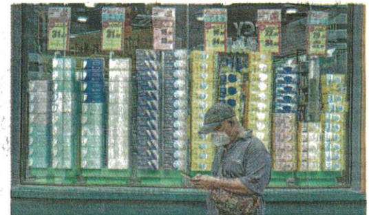
PELBAGAI variasi pelitup muka dijual bagi mengekang penularan di sekitar Bukit Bintang, Kuala Lumpur semalam.

"Berdasarkan status vaksinasi, terdapat 47 kes kategori lima iaitu tiga kes ada sejarah vaksinasi dan 44 kes tiada sejarah vaksinasi; serta 138 kes kategori empat dengan 20 kes ada sejarah vaksinasi dan 118 kes tiada sejarah vaksinasi," katanya dalam satu kenyataan akhbar di sini semalam.