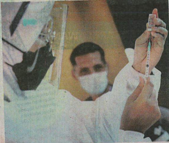
PEMBERIAN vaksin kepada rakyat Malaysia dan juga pekerja warga asing ketika ini adalah secara percuma. — GAMBAR HIASAN

"Kita tahu bahawa vaksin ini sepatutnya diberikan secara percuma kepada orang ramai, tetapi biasanya, kalau ada bayaran cepat sikit prosesnya. Pembayaran melalui online sahaja," katanya.