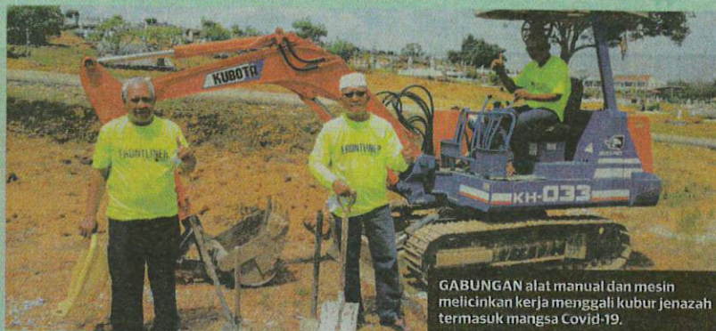
GABUNGAN alat manual dan mesin melicinkan kerja menggali kubur jenazah termasuk mangsa Covid-19.