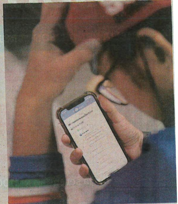
NAMA individu yang membeli slot janji temu vaksinasi akan dimasukkan dalam aplikasi MySejahtera bagi memudahkan urusan suntikan.