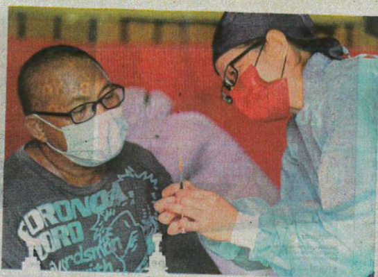
Jururawat menunjukkan picagari mengandungi vaksin jenis Sinovac kepada seorang penerima sebelum memberi suntikan di Dewan Datuk James Ratib di Botfition, Sabah.

Katanya, kajian menunjukkan vaksin itu melindungi individu daripada jangkitan SARS-CoV-2 iaitu virus penyebab Covid-19.