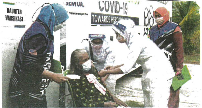
An Orang Asli resident of Kampung Pulau Kempas getting vaccinated during an outreach programme in Jenjarom, Banting, yesterday.

Since the Covid-19 National Immunisation Programme was implemented on Feb 24, the cumulative vaccine doses dispensed nationwide stood at 18,946,048 shots, involving 12,841,212 people getting their first shot and 6,104,836 people getting their second. Bernamea