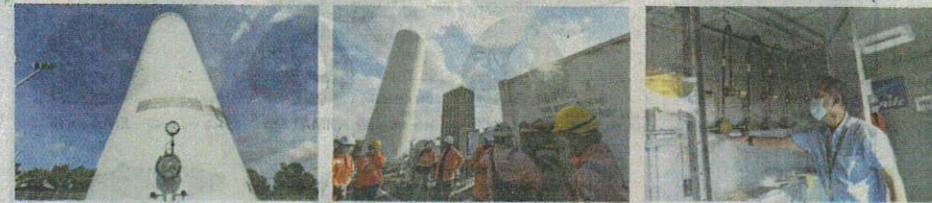
LOJI pengisian oksigen di PKRC Maeps 2.0 adalah yang pertama dibina di luar kawasan hospital.