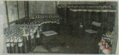
DIANGGARKAN 2,000 tong oksigen digunakan untuk rawatan pesakit Covid-19 di PKRC Maeps 2.0 setiap hari.