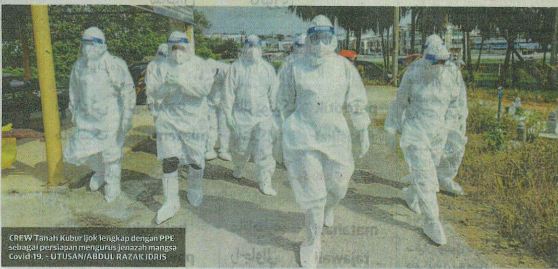
CREW Tanah Kubur Ijok lengkap dengan PPE sebagai persiapan mengurus jenazah mangsa Covid-19.

Tinjauan Utusan Malaysia mendapati kawasan perkuburan tersebut bukan sahaja bersih malahan tersusun untuk diziarahi para waris.