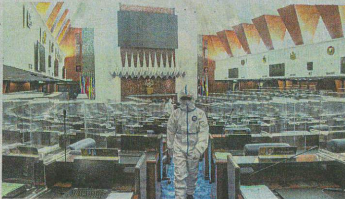
Safety first: Fire and Rescue personnel sanitising the Dewan Rakyat after several Covid-19 positive cases were detected in Parliament.

Selangor had the most number of fatalities: with 70 cases reported, followed by Kuala Lumpur with 20.