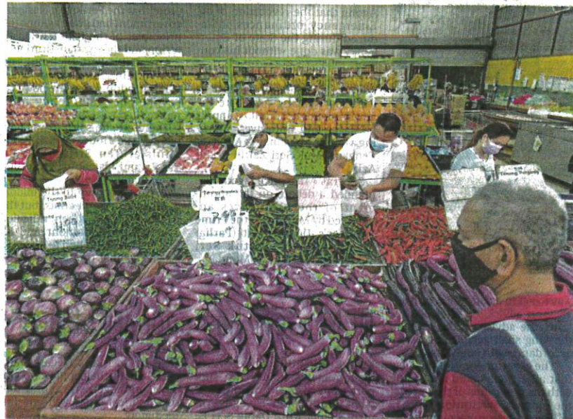
Customers adhering to the standard operating procedures at a supermarket in Kuala Lumpur yesterday.

Dr. Noor Hisham said 97.7 per cent, or 16,787, of yesterday's cases involved patients in Category 1