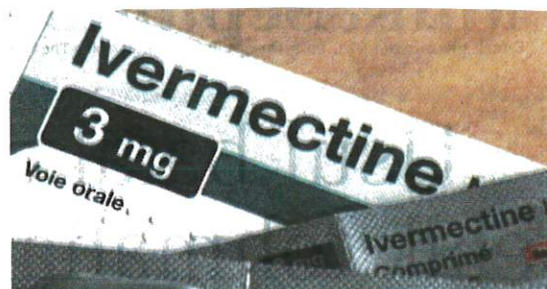
Pihak penguat kuasa perlu menyita ivermectin yang dijual secara meluas di pasaran bagi mengelakkan kesan sampingan kepada pengguna.

Ubat belum daftar untuk rawat wabak dibimbangi beri kesan buruk kepada kesihatan